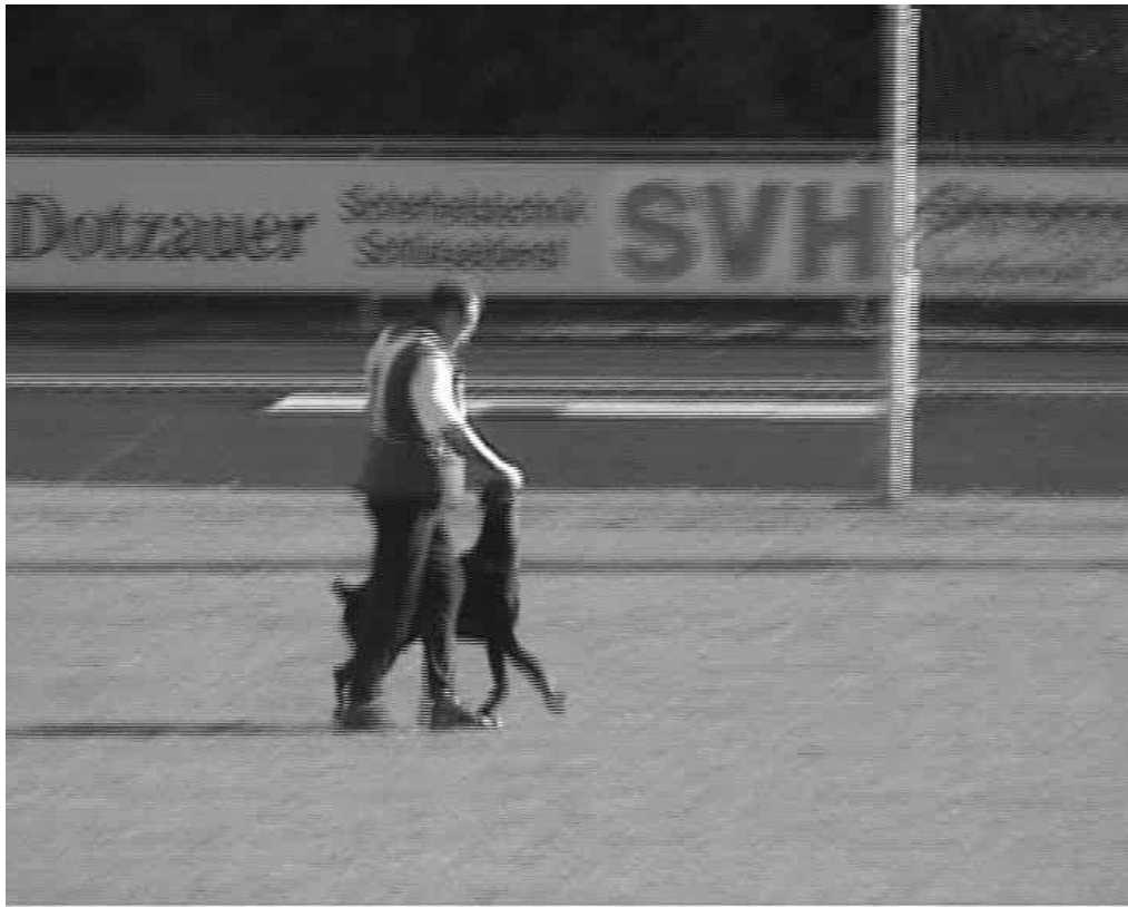
Aivo Oblikas 28.08.05.